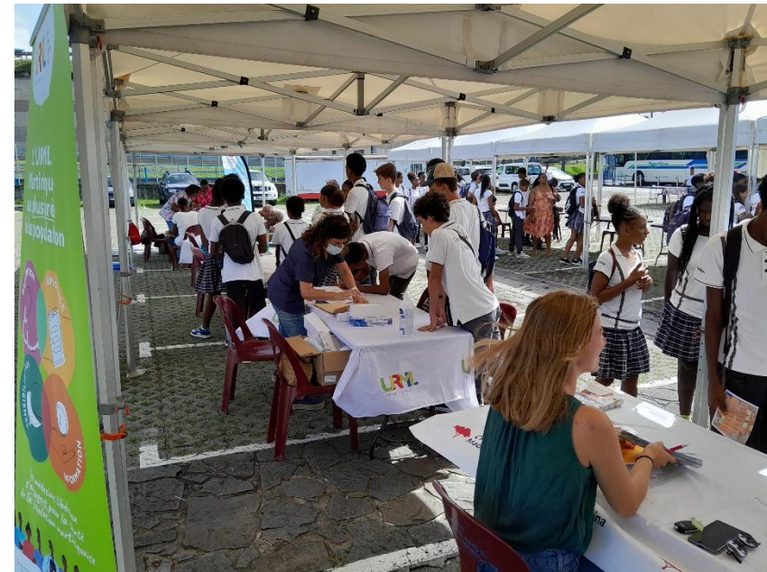
Médecin Généraliste et Chirurgien-dentiste